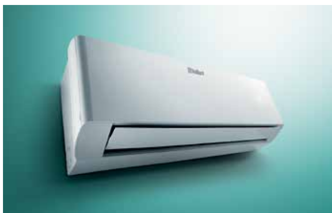
climaVAIR VAI 8 plus unutrašnja jedinica