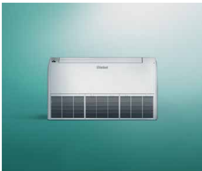
Podna unutrašnja jedinica