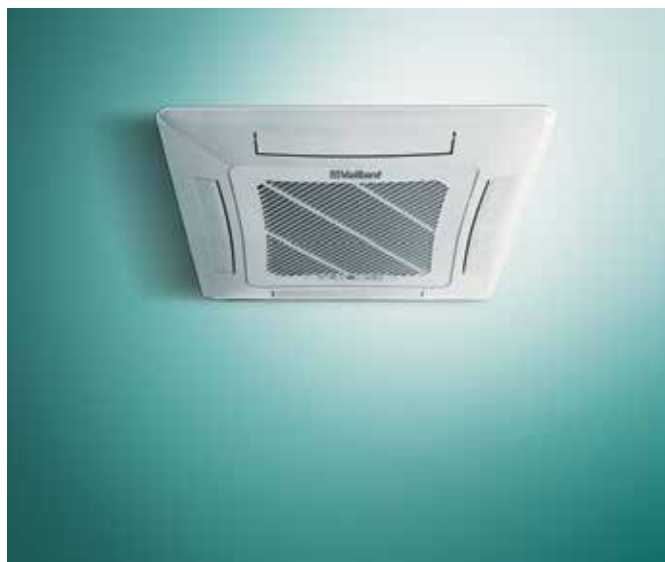
Kasetna unutrašnja jedinica