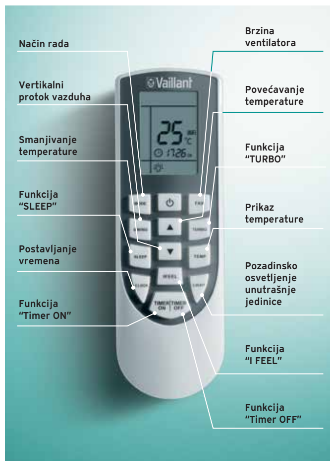
climaVAIR VAI 8 plus daljinski upravljač