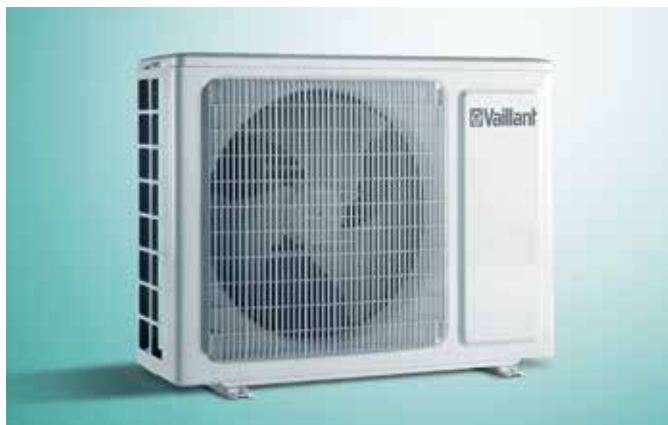
climaVAIR VAI 8 plus spoljašnja jedinica

za MultiSplit sisteme dostupne su zidne, podne i kasetne unutrašnje jedinice